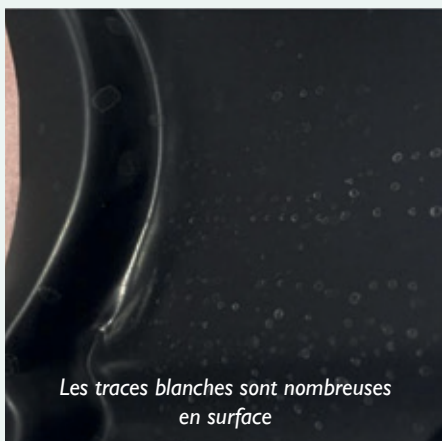
Les traces blanches sont nombreuses en surface

Notre processus de traitement de surface implique plusieurs étapes, notamment le dégraissage, le rinçage, le séchage, le poufrage et la cuisson. Malgré notre rigueur