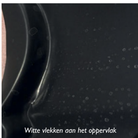
Witte vlekken aan het oppervlak

Het proces van oppervlaktebehandeling omvat verschillende stappen, waaronder ontvetten, spoelen, drogen, poedercoaten en bakken. Ondanks de nauwgezetheid en aandacht voor detail waren er moeilijkheden met het ontvettingsproces, wat heeft geleid tot inefficiëntie bij het verwijderen van oppervlakteverontreinigingen. Boven-